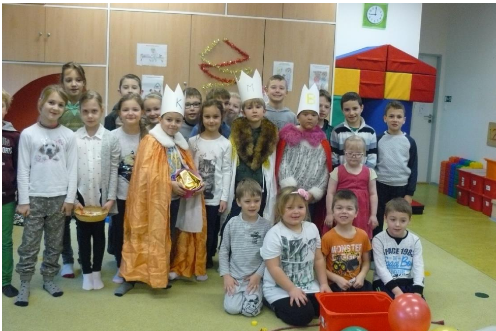
Druháci s dětmi z MŠ