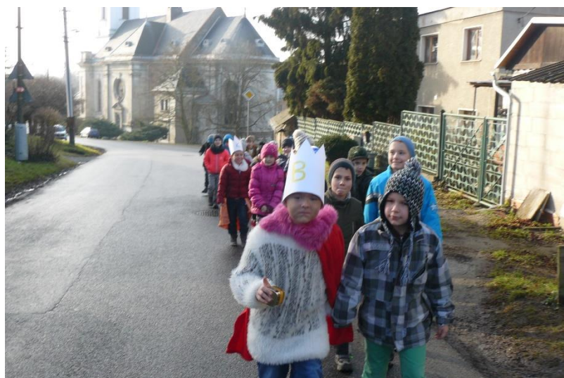
Přesun po obci